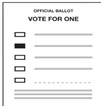
Vote por el número permitido