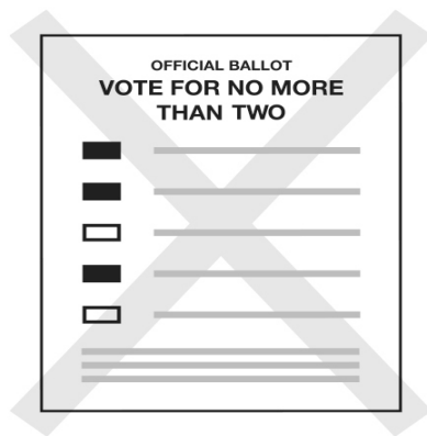
No vote por demás

Si llega a estropear su papeleta de voto y desea que se le envíe otra, coloque el voto nulo en el sobre de envío e inmediatamente envíelo a la Oficina del Secretario del Condado de Sierra. Asegúrese de marcar la casilla marcada " Spoiled " (Estropeado) en el sobre de retorno y firme su nombre en el espacio proporcionado.